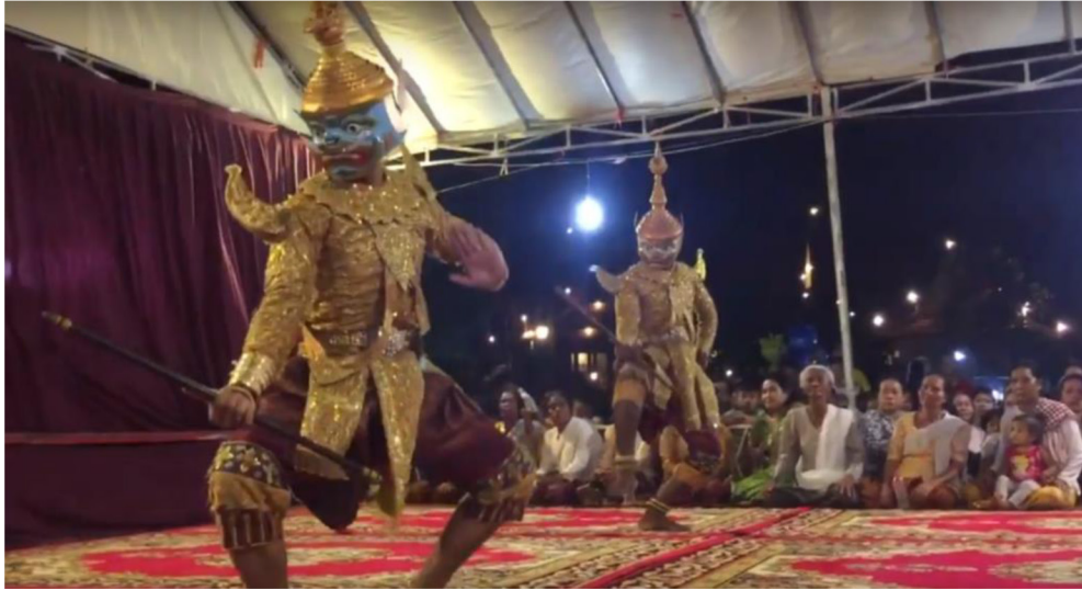
រូបលេខ២៖ ល្ខោនខោលវត្តស្វាយអណ្តែត (ប្រភព៖ https://www.youtube.com/watch?v=M6ZhRxs8AJ4 )

ប៉ុន្តែនៅពេលណាមួយយើងថែទាំបានល្អ លែងប្រឈមនឹងការបាត់បង់ យើងអាចស្នើបញ្ចូលក្នុងបញ្ជីតំណាង (Representative List) នៅពីរ ឬបីឆ្នាំក្រោយមកទៀត។