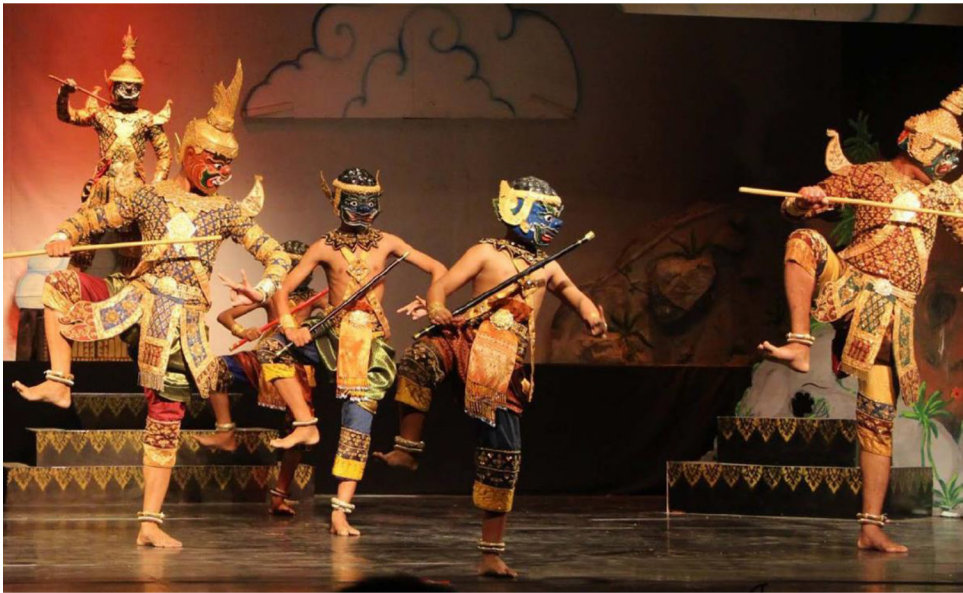
រូបលេខ១៖ ការសម្តែងល្ខោនខោល

ក្នុងសេចក្តីដែលនឹងរៀបរាប់ទៅខាងមុខទៀតនេះ យើងនឹងបង្ហាញពីលក្ខណៈសម្បត្តិពិសេសដែលល្ខោនខោលវត្តស្វាយអណ្តែតបានចុះក្នុងបញ្ជីបេតិកភណ្ឌពិភពលោក ដំណើរការនៃការចុះបញ្ជីបេតិកភណ្ឌ និងលក្ខណៈវិនិច្ឆ័យរបស់អង្គការយូណេស្កូ។