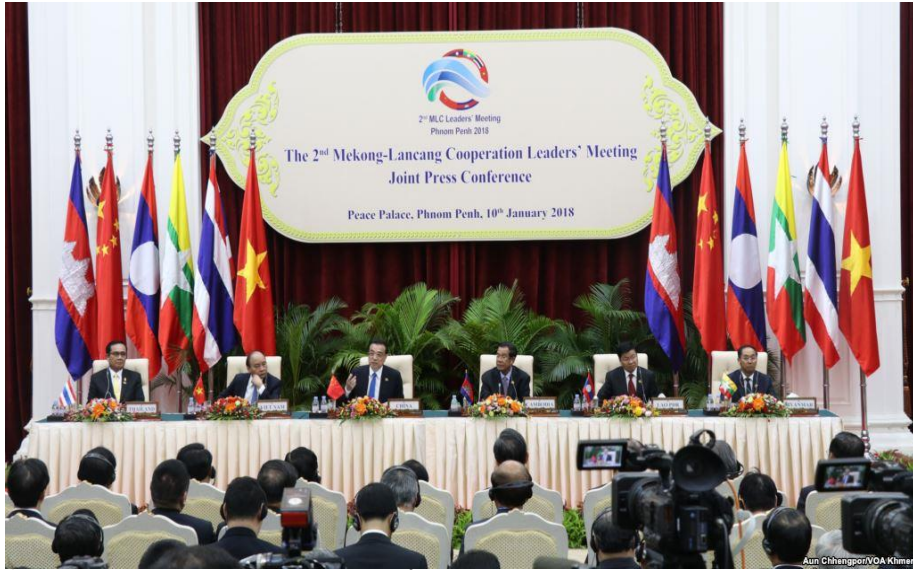
មេដឹកនាំប្រទេសចិន និងប្រទេស៥ទៀត រួមមានប្រទេសមីយ៉ាន់ម៉ា ឡាវ ថៃ កម្ពុជា និងវៀតណាម បានជួបជុំគ្នានៅរាជធានីភ្នំពេញ បានចូលរួមក្នុងកិច្ចប្រជុំកំពូលនេះ កាលពីថ្ងៃពុធទី១០ ខែមករា ឆ្នាំ២០១៨ ។