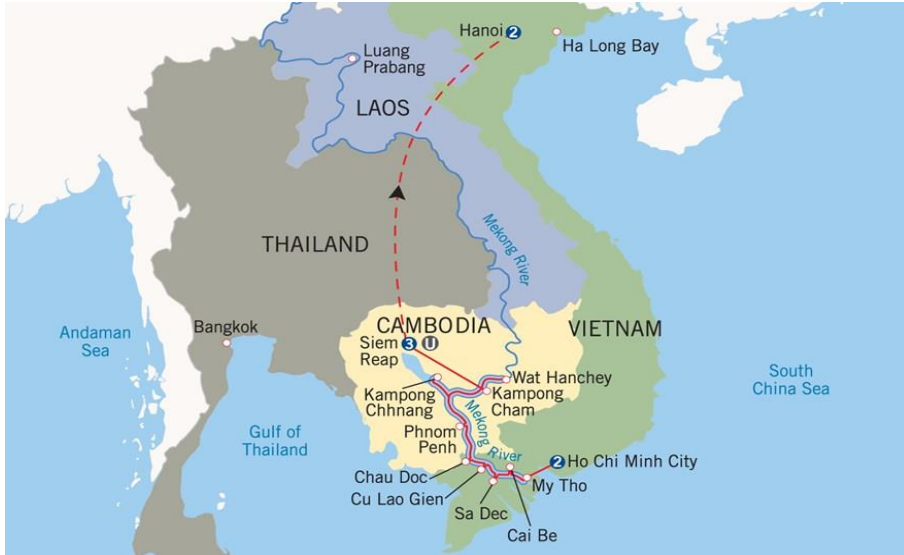
លំហូរនៃប្រព័ន្ធទឹកទន្លេមេគង្គ