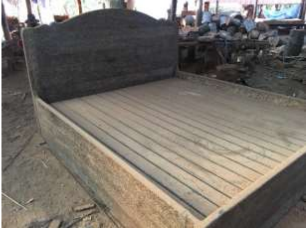
គ្រែបារាំងនិងគ្រែម៉ុងធ្វើពីឌីមត្នោត