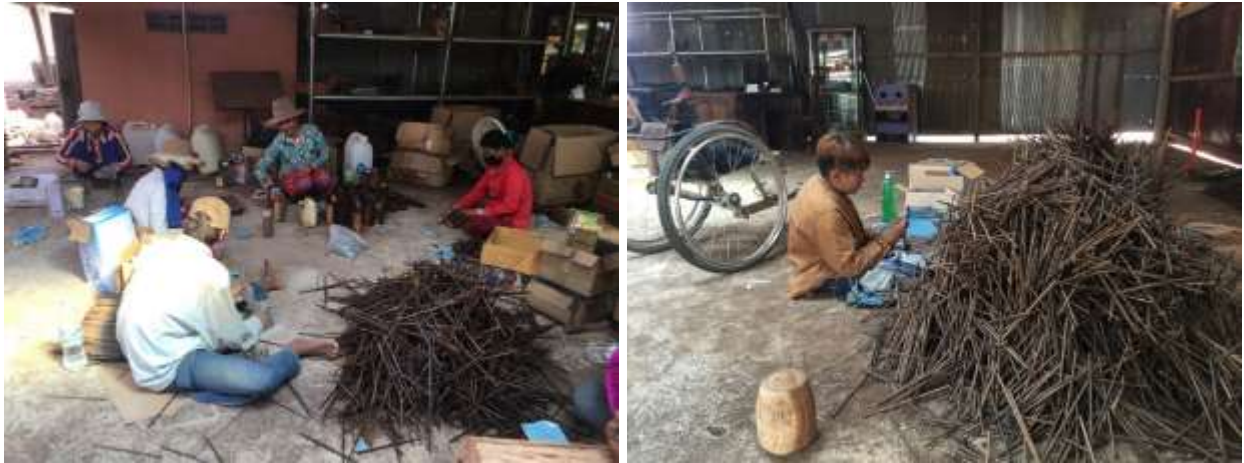
សកម្មភាពកម្មករផ្នែកខាត់សម្អាតនិងប្រើថ្នាំលាបឱ្យភ្លឺស្អាត

ដោយប្រើជក់ម៉ូទ័រ ៦ ។ យើងសង្កេតឃើញថា គ្រឿងសង្ហារឹមដែលផលិតពីខ្លឹមត្នោតនៅក្នុងសិប្បកម្មនេះ គឺ មិនមានបាញ់ថ្នាំឱ្យប្រាសចាកពីពណ៌ធម្មជាតិរបស់ត្នោតដូចគ្រឿងសង្ហារឹមដែលផលិតពីឈើឡើយ។