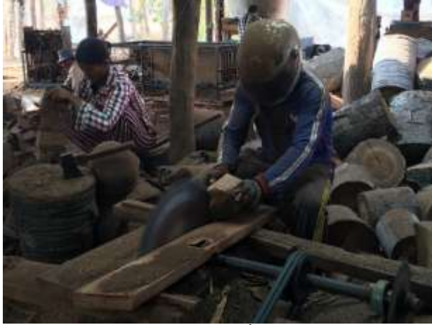
ម៉ាស៊ីនច្រៀក