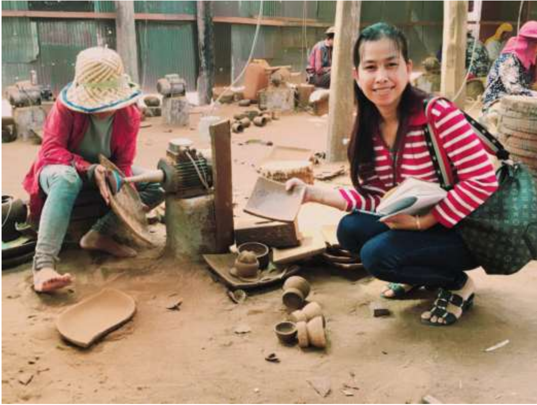
អ្នកស្រាវជ្រាវនិងសិប្បករវិនីនៅក្នុងសិប្បកម្ម សាន ពៅ