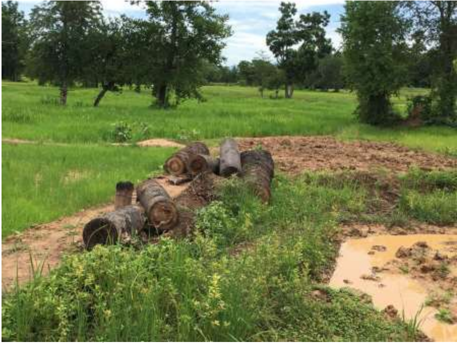
ដើមត្នោតដែលប្រជាជនកាប់និងអារចោលនៅតាមស្រែ

ក្រៅពីនេះ មានទិដ្ឋភាពផ្សេងទៀតដែលយើងគួរព្រួយបារម្ភអំពីកត្តាដែលនាំឱ្យបាត់បង់ដើមត្នោត នៅក្នុងប្រទេស នោះគឺ ការអភិវឌ្ឍដែលមានចលនាកាន់តែខ្លាំងឡើងៗ។ ដើមត្នោតជាច្រើនត្រូវកាត់ និង ដុតចោល ដើម្បីកែប្រែបរិវេណដីសម្រាប់បម្រើតម្រូវការផ្សេងៗ ដូចជា លំនៅដ្ឋាន ឬ ទីប្រកបរបរ អាជីវកម្មផ្សេងៗ។ ជាទូទៅ យើងឃើញដើមត្នោតទាំងនោះជាច្រើន ពុំត្រូវបានកែច្នៃជាវត្ថុសម្ភារៈសម្រាប់ ប្រើប្រាស់ជាប្រយោជន៍អ្វីឡើយ។ ការអភិវឌ្ឍនឹងមានចលនាកាន់តែខ្លាំងឡើងថែមទៀត ហើយតម្រូវការ នៃការកែប្រែដី ដែលនឹងធ្វើឱ្យបាត់បង់ដើមត្នោតនិងរុក្ខជាតិផ្សេងទៀត ក៏នឹងកាន់តែមានទំហំធំធេង ផងដែរ។