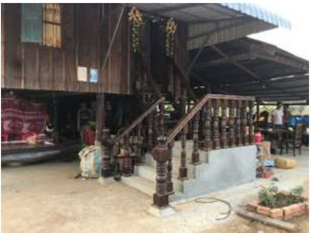
ទូជាប់ជញ្ជាំង តុ សាឡុង និង បង្កាន់ដៃ ធ្វើពីឌីមត្នោត