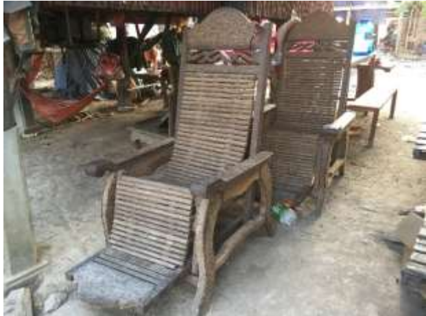
កៅអីនិងហង្សតេធ្វើពីឌីមត្នោត