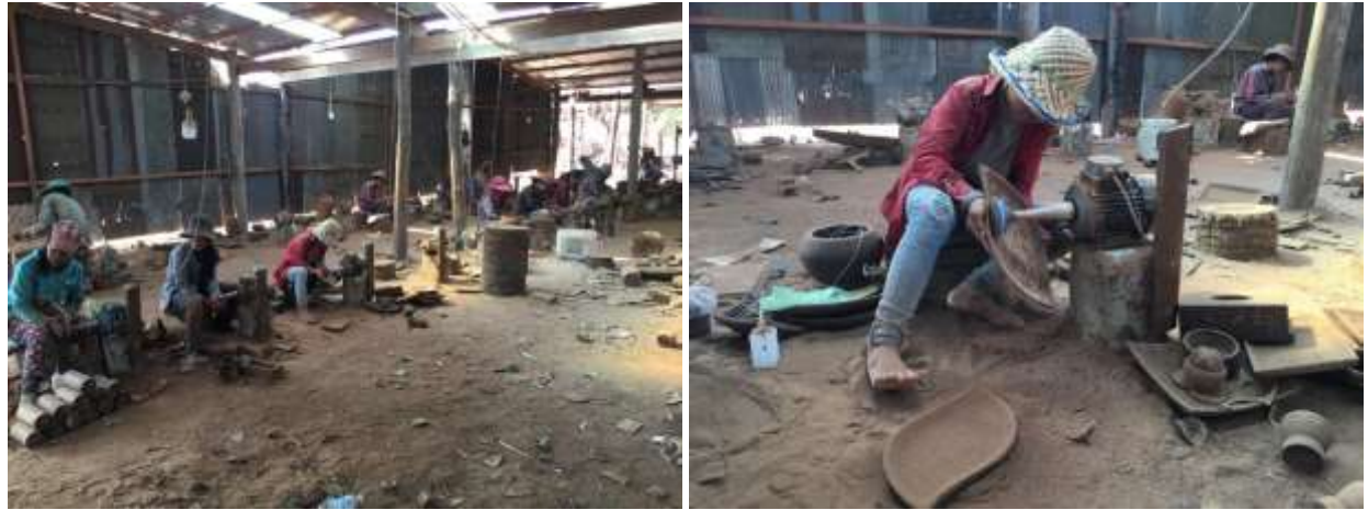
សកម្មភាពកម្មករខាត់វត្ថុសម្ភារៈដោយប្រើម៉ូទ័រខាត់

បច្ចុប្បន្ននេះ សិប្បកម្ម សាន ពៅ មានគ្រឿងឧបករណ៍សម្រាប់ដំណើរការសិប្បកម្មទាំងមូលច្រើន ប្រភេទ ហើយគ្រឿងឧបករណ៍ទាំងនេះបានមកពីការសន្សំនិងការពង្រីកដំណើរការផលិតជាបន្តបន្ទាប់ ចាប់តាំងពីសិប្បកម្មនេះកកើតឡើង។