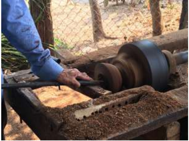
ម៉ាស៊ីនក្រឡឹង