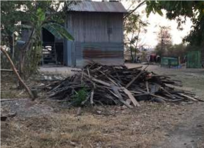
ចំនៀវត្នោតដែលអ្នកភូមិយកមកធ្វើជាឧស