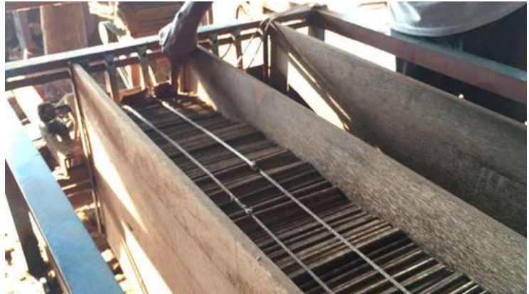
ចង្កឹះដែលផលិតចេញពីម៉ាស៊ីនផលិតចង្កឹះ និង ម៉ាស៊ីនខាត់ចង្កឹះ