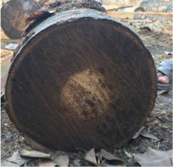
ដើមត្នោតមានខ្លឹមសងខាងនិងមានស្រាយនៅកណ្តាល