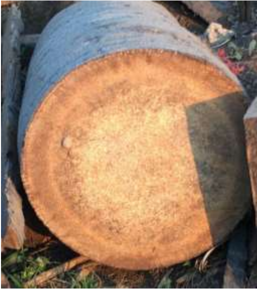
ដើមត្នោតគ្មានខ្លឹម

ដើមត្នោតមានខ្លឹមច្រើនឬតិច គឺអាស្រ័យលើអាយុកាលនៃដើមត្នោតនោះ។ ប្រសិនបើ ដើមត្នោតចាស់ មានអាយុច្រើន នោះវានឹងមានខ្លឹមច្រើន (ខ្លឹមក្រាស់) ឯដើមត្នោតខ្ចី អាយុតិច នោះវានឹង មានខ្លឹមតិច (ខ្លឹមស្តើង) ហើយមានស្រាយច្រើន។ ដើមត្នោតដែលមានអាយុកាលចាប់ពី ១០០ ឆ្នាំឡើង ទៅ ទើបមានខ្លឹមល្អសម្រាប់ការផលិតជាវត្តសម្ភារៈផ្សេងៗ។