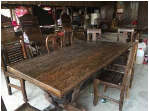
សម្ភារៈខ្នាតធំផលិតពីខ្លឹមត្នោត