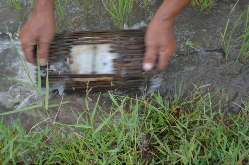
ការលាងសម្អាតលបនៅពេលលើកលប

ការបិទដីជុំវិញសន្ទះមាត់លបនៅសល់បន្ទះឫស្សីលបដែលអាចនាំឱ្យមានករណីកង្កែបរត់ នៅពេលលើកលប គេត្រូវលាងសម្អាតលបដែលមានប្រឡាក់ដីបិទលបមួយដំណាក់កាល សិន មុននឹងលើកយកទៅផ្ទះ។ បន្ទាប់ពីលើកលបមកដល់ផ្ទះនិងចាប់យកកង្កែបចេញអស់ហើយ តែត្រូវលាងសម្អាតលបម្តងទៀតឱ្យស្អាត រួចព្យួរទុក ដើម្បីការពារមិនឱ្យលបឆាប់ពុកផុយលឿន។ ទោះយ៉ាងណា លបធ្វើពីបន្ទះឫស្សីអាចប្រើការបានតែត្រឹមរយៈពេលពីរឆ្នាំប៉ុណ្ណោះ។