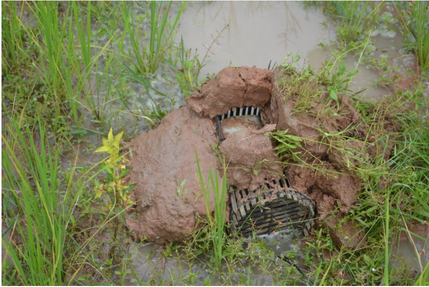
ការដាក់លបកង្កែប (លបសន្ទុះ) ក្នុងស្រែ (មើលពីចំហៀង)

ដោយអ្នកប្រកបរបររកកង្កែបម្នាក់តែងដាក់លបច្រើនក្នុងមួយយប់ៗ ហើយក៏មានអ្នកប្រកបរបររកកង្កែបច្រើននាក់ទៀតនោះ អ្នកដាក់លបត្រូវប្រុងប្រយ័ត្នក្នុងការកំណត់ចំណាំទីតាំងដាក់លបរបស់ខ្លួន ដើម្បីកុំឱ្យរង្វេងនៅពេលមកលើកលបវិញ។ គេត្រូវចំណាំស្រែនិងចំនួនលបដែលគេបានដាក់ ហើយត្រូវធ្វើសញ្ញាសម្គាល់ ដូចជាកាប់ដីមួយចបនៅលើភ្នំស្រែជាដើមសម្រាប់ចំណាំដើម្បីគេអាចចូលទៅរកលបក្នុងស្រែទាំងនោះឃើញ។