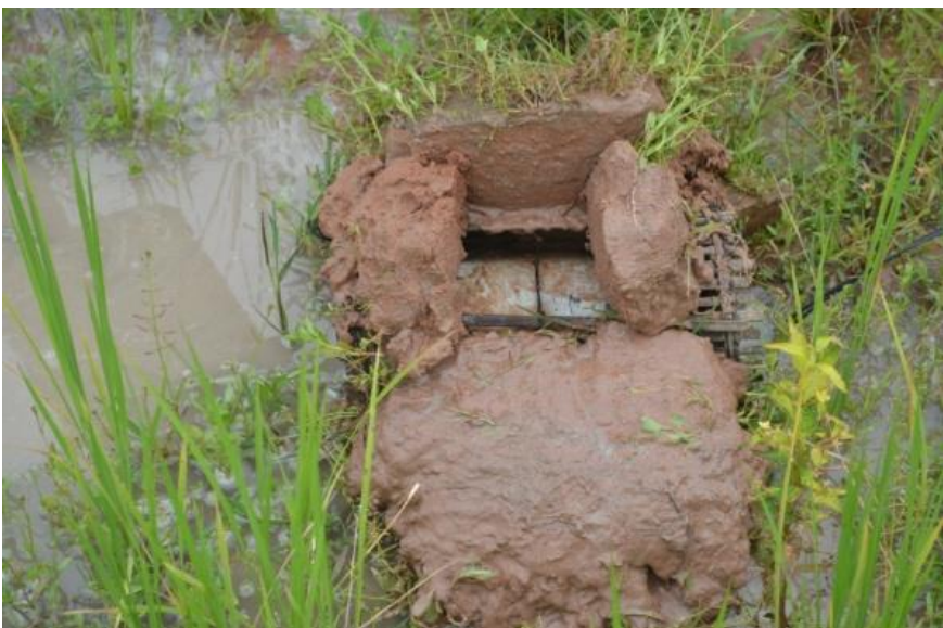
ការដាក់លបកង្កែប (លបសន្ទះ) ក្នុងស្រែ (មើលពីមុខ)

ទៅដល់ទីតាំងកំណត់ដែលត្រូវដាក់លប គេដាក់លបនៅទីតាំងដ៏សមគួរមួយ ហើយគេ កាប់ដីមួយចបបិទដាក់ពីក្រោយសន្ទះលប មួយចបដាក់បិទពីឆ្វេងសន្ទះលប មួយចបដាក់បិទពី ស្តាំសន្ទះលប និងមួយចបទៀតសម្រាប់ដាក់រាបខាងមុខសន្ទះលបដើម្បីធ្វើផ្លូវឱ្យកង្កែបចូលទៅ ស៊ីនុយ។ បន្ទាប់ពីកាប់ដីបិទមាត់លបរួចហើយ គេយកនុយក្បាលត្រីឬកំពិសដោតជាប់នឹងបន្ទះដី បិទក្រោយសន្ទះលប រួចយកទឹកនុយបោះក្បែរៗទីតាំងដាក់លបនោះ ដើម្បីឱ្យមានក្លិនឆ្អាបទាក់ ទាញដល់សត្វកង្កែប។ ជាទូទៅ គេដាក់លបចាប់យកកង្កែបនៅក្នុងស្រែដែលមានស្រូវ ហើយគេ អាចដាក់លបមួយ ឬ ពីរ ឬ ច្រើនជាងនេះ ទៅតាមទំហំស្រែ។