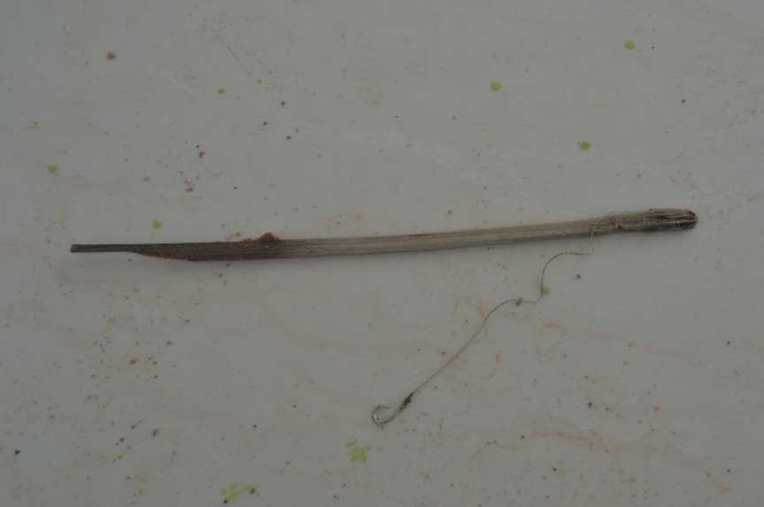
បង្កើតស្នឹង ដែលអ្នកភូមិព្រៃដក់ពរច្រើនម្រាប់បង្កើតយកកង្កែប

បង្កើតស្នឹង ធ្វើពីបន្ទោះឫស្សីមួយបន្ទោះ មានប្រវែងប្រមាណ២៥សង់ទីម៉ែត្រ មានខ្សែបង្កើត (ធ្វើពីខ្សែនីឡុង) ប្រវែងប្រមាណ២៥សង់ទីម៉ែត្រ ដោយចុងម្ខាងខ្សែចុងភ្ជាប់នឹងចុងដងបង្កើត ហើយចុងខ្សែម្ខាងទៀតចងផ្ទៃសន្ទូច។ ជាទូទៅ គេសម្រួចគល់ដងបង្កើតឱ្យស្រួចដើម្បីឱ្យងាយ ដោតចូលជាប់ទៅក្នុងដី។