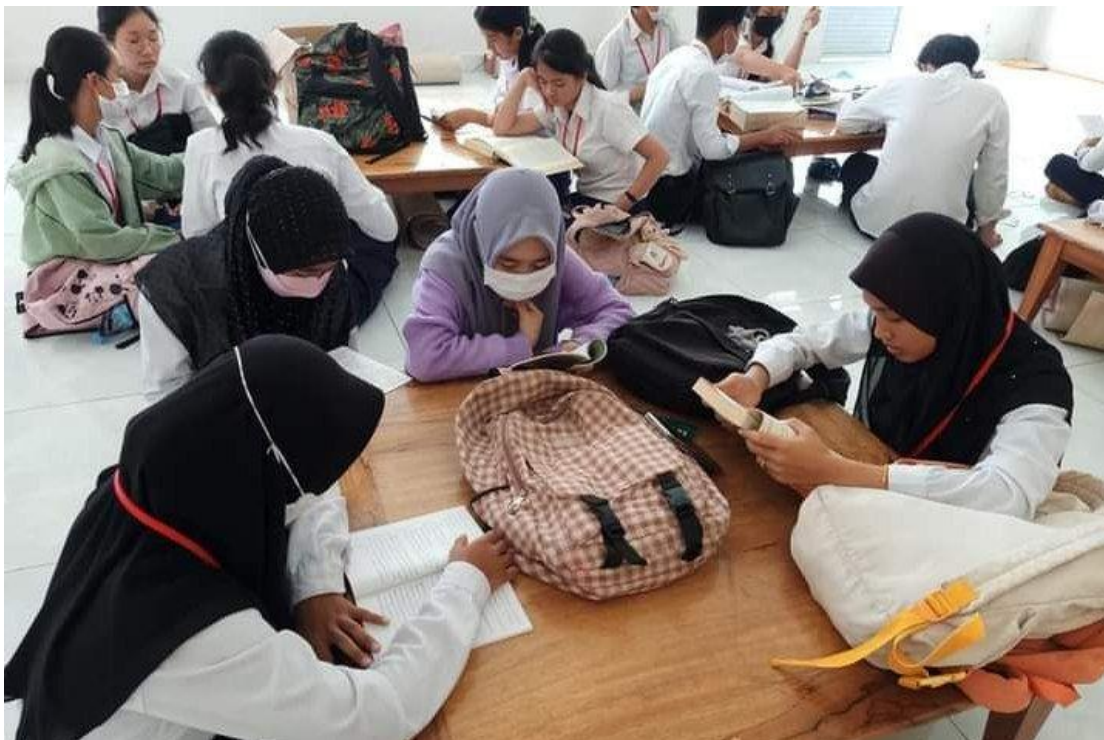
រូបភាពសិស្សានុសិស្សខ្មែរអ៊ីស្លាមសិក្សាជាគ្រុមក្នុងបណ្ណាល័យ