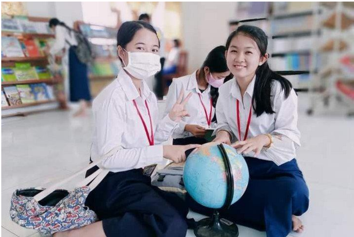
រូបភាពសកម្មភាពសិក្សាក្នុងថ្នាក់និងស្វ័យសិក្សាក្នុងបណ្ណាល័យ