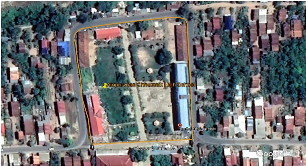
ផែននទីបង្ហាញពីទីតាំងវិទ្យាល័យប៊ុនរ៉ានីហ៊ុនសែនអម្ពរ៉ែនជំនីក