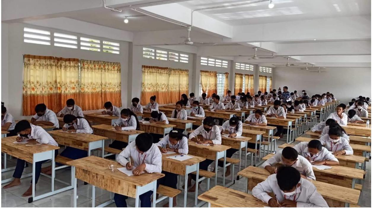
រូបភាពសកម្មភាពសិក្សាក្នុងថ្នាក់និងស្វ័យសិក្សាក្នុងបណ្ណាល័យ