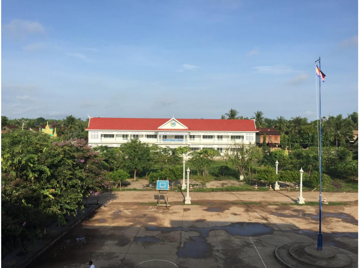
រូបភាពបង្ហាញពីអគារធនធាននិងកន្លែងលេងកីឡាបាល់បោះ