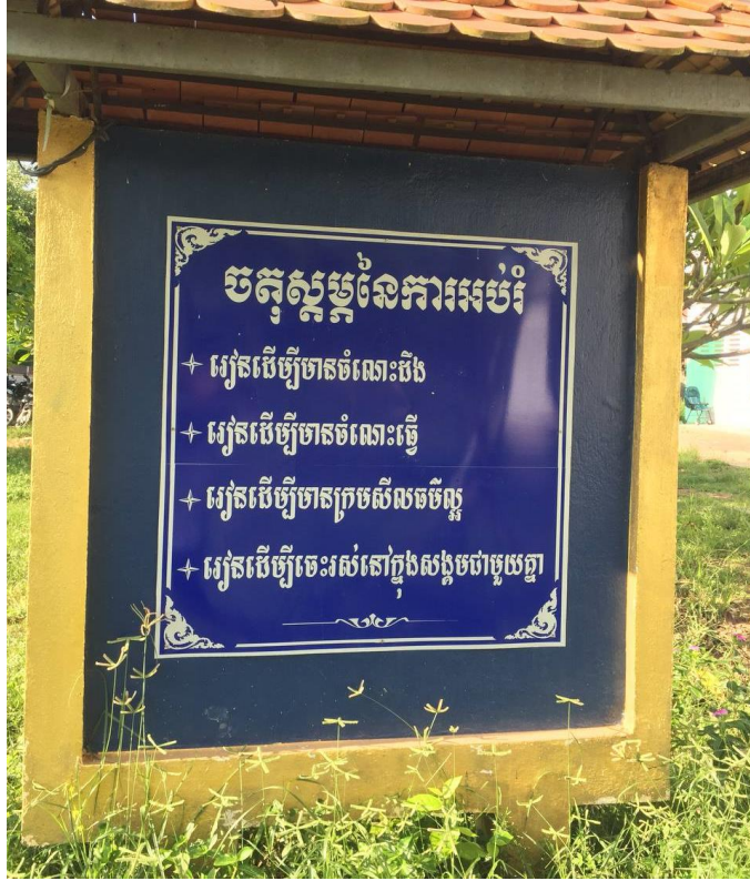
រូបភាពប៉ាណូ «ចតុស្តម្ភការអប់រំ» តាំងក្នុងបរិវេណវិទ្យាល័យ