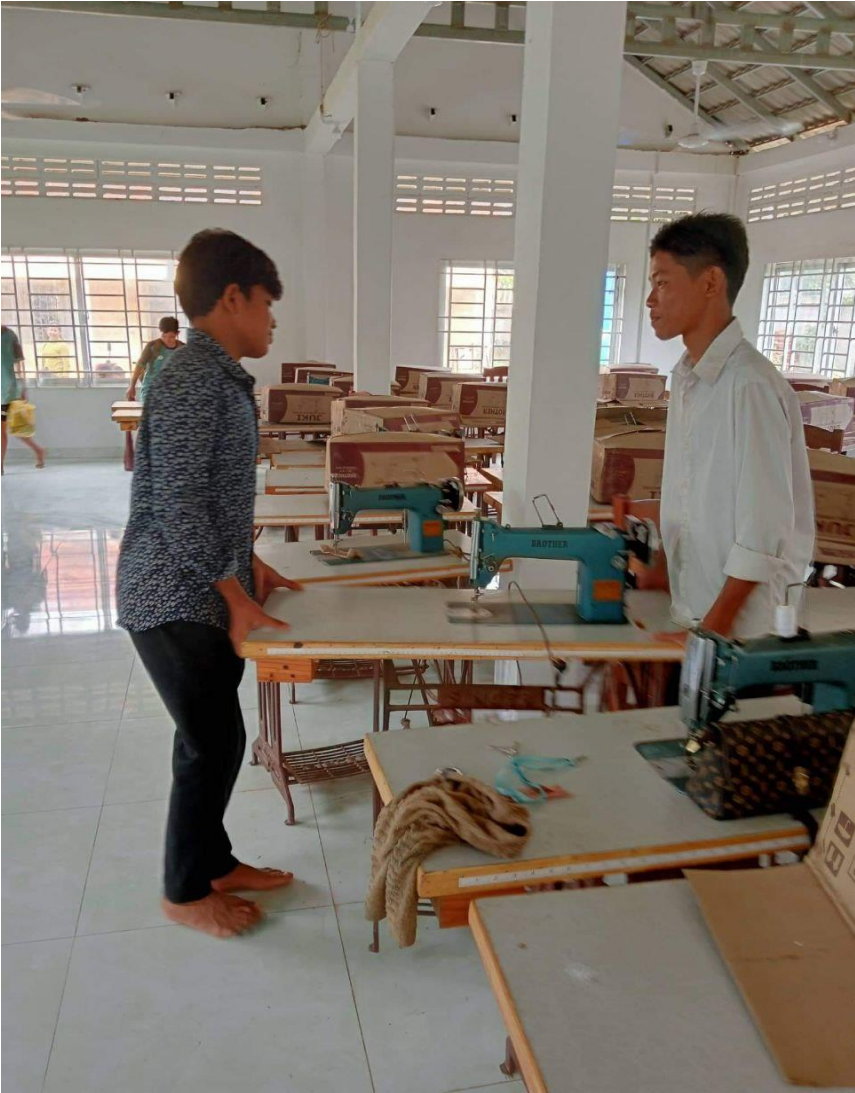
រូបភាពបង្ហាញសកម្មភាពសិស្សានុសិស្សជួយរៀបចំអគារកាត់ដេរ

យកចិត្តទុកដាក់លើសមភាពយេនឌ័ររវាងសិស្សប្រុសនិងសិស្សស្រី។ នាយក ត្រូវពិនិត្យលើចំណាត់ការនេះឱ្យបានល្អនិងច្បាស់លាស់ ព្រោះការរៀបចំរបាយសិស្សនេះ ក៏ជាផ្នែកមួយសំខាន់ដែលជះឥទ្ធិពលដល់ការបង្រៀននិងរៀនរបស់គ្រូនិងសិស្សដែរ ។