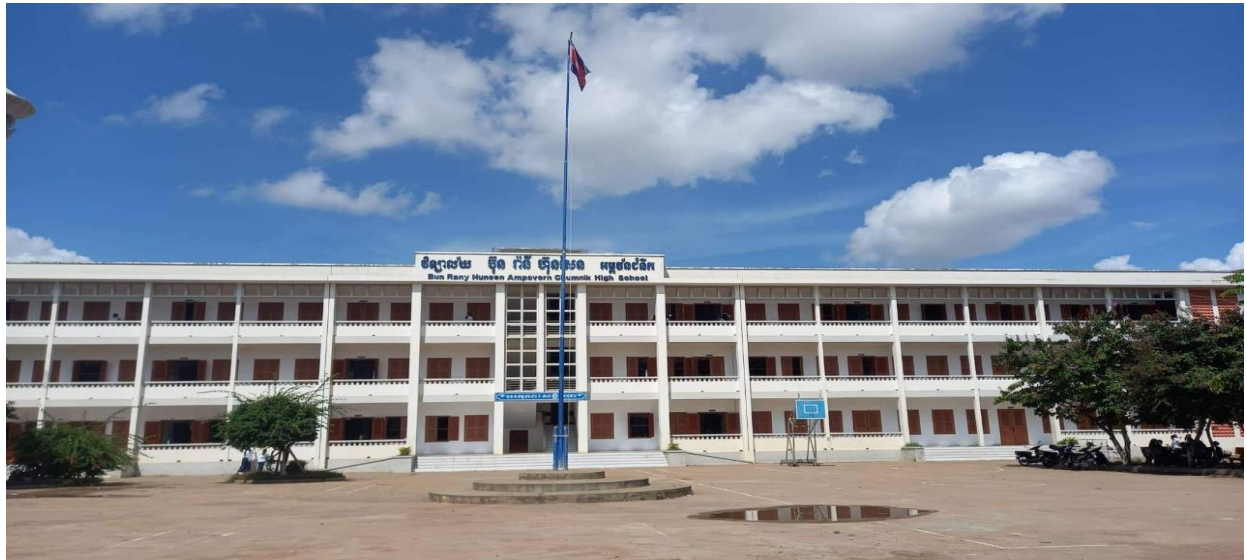
វិទ្យាល័យប៊ុនរ៉ានីប៊ុនសែនអង្គរជំនីក ស្ថិតក្នុងខេត្តត្បូងឃ្មុំ (រូបភាពឆ្នាំ២០២២)

ដើម្បីសម្រេចទិសដៅយុទ្ធសាស្ត្ររាជរដ្ឋាភិបាល បានយកចិត្តទុកដាក់លើការអភិវឌ្ឍ ធនធានមនុស្សយ៉ាងខ្លាំង ពីព្រោះធនធានមនុស្ស គឺសំខាន់សម្រាប់ការអភិវឌ្ឍប្រទេសជាតិរយៈ ពេលយូរអង្វែង។ ទន្ទឹមនឹងនេះដែរ ការស្រាវជ្រាវនេះ មានបំណងរកឱ្យឃើញជាក់ស្តែងនៃដំណើរ ការងាររដ្ឋបាលនៅវិទ្យាល័យមួយ ក៏ជាការសង្កេតនិងទាញយកនូវស្ថិតិស្ថេរភាពរមកវិភាគនិងបក ស្រាយឱ្យបានច្បាស់លាស់ ដើម្បីជាពន្លឺក្នុងការអនុវត្តបន្តទៀតរបស់អ្នកសិក្សាក្រោយ។ ជាពិសេស អ្នកគ្រប់គ្រងអប់រំ អ្នកគ្រប់គ្រងរដ្ឋបាលនាសម័យថ្មីនេះ ។