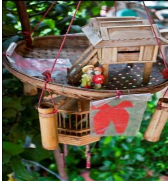
ម្រេញគង្វាល

មានព្យួរសម្លៀកបំពាក់(កូនខោអាវ)ពណ៌ ក្រហម៤សម្រាប់ និងរបស់ក្មេងលេង ដូចជា កូនឃ្លី កូនបាល់ ... នៅមុខផ្ទះរបស់ប្រជាជន ខ្មែរសឹងតែគ្រប់ផ្ទះ នោះគឺជាលំនៅស្ថាន របស់ម្រេញគង្វាល។ ហើយជានិច្ចកាល ម្ចាស់ផ្ទះ សែនព្រេនចំណី ដូចជា ស្ករគ្រាប់ និង ទឹកដា ដើម ដោយមានជំនឿថា ម្រេញគង្វាលនឹងផ្តល់ចំពោះគេនូវសេចក្តី សុខ សេចក្តីចម្រើន ឱ្យមុខរបររកស៊ីរបស់គេ បានរីកចម្រើនលូតលាស់ជាពុំខាន។ តាម ការសង្កេតរបស់យើងឃើញថា ប្រជាជនខ្មែរ គោរពបូជាម្រេញគង្វាលសឹងតែគ្រប់ផ្ទះទាំង អស់។ នៅតាមទីសាធារណៈ និងកន្លែងលក់ ដូរមួយចំនួនក៏គេរៀបចំសំណែនសម្រាប់ ម្រេញគង្វាលដែរ។