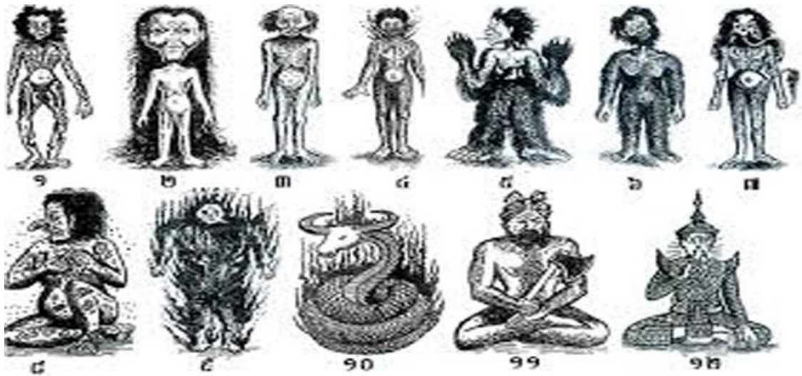
ប្រភេទប្រេតទាំង១២ពួកក្នុងជំនឿខ្មែរ