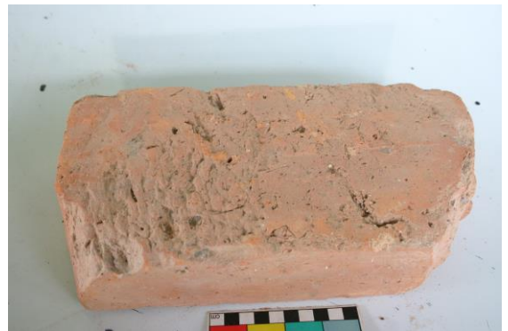
រូបទី៦៖ ឥដ្ឋប្រាសាទ

ចាប់តាំងពីមានការសិក្សាស្រាវជ្រាវរហូតដល់បច្ចុប្បន្ន ពុំមានឯកសារ ឬអ្នកស្រាវជ្រាវណាមួយសិក្សារបង្ហាញអំពីបច្ចេកទេសនៃការផលិតឥដ្ឋនៅឡើយទេ។ តើគេអាចដុតឥដ្ឋជាមួយកាជន៍ដែរឬទេ? ទើបបានជាឥដ្ឋមានជាប់ស្រទាប់រលោងដូច្នោះ?