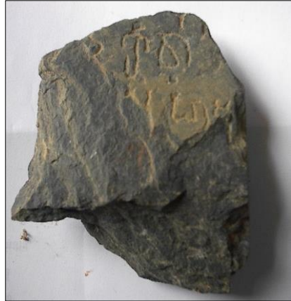
រូបទី៥៖ បំណែកសិលាចារឹកមានពាក្យ កុ និង វា

សិទ្ធិសួរ (Siddheçvara) ជាប្រភពច្បាស់ បង្ហាញពីភ្នំបាសិត។ បើតាមលោក លុយ ណេ ដឺ ឡាហ្សង់គៀរ (Lunet de La jonquière) បានបញ្ជាក់អំពីលក្ខណៈ និងទម្រង់នៃ សិលាចារឹកទាំងនោះថាអត្ថបទសិលាចារឹក មកពីស្រែអំពិលមាន១៦បន្ទាត់ ឯសិលា ចារឹកមកពីភ្នំបាសិតមាន២៩បន្ទាត់ មានវត្ថុ ជាតិ និងទំហំនៃថ្មមានលក្ខណៈ ដូចគ្នា (E. Lunet de Lajonquière 1902: 82)។