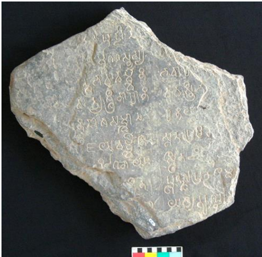
រូបទី៦៖ បំណែកសិលាចារឹករកឃើញ ដោយកុមារសន្តិភាពស្រែអំពិល

សរុបសេចក្តីមក ទិន្នន័យដែលបាន មកពីស្ថានីយនេះតាមរយៈសិលាចារឹក គឺជា តិកតាងមួយអាចបញ្ជាក់បានថាជាស្ថានីយមាន កាលបរិច្ឆេទក្នុងសម័យមុនអង្គររវាងសតវត្ស ទី៧-៨ ក្នុងរាជ្យព្រះបាទជ័យវរ្ម័នទី១។