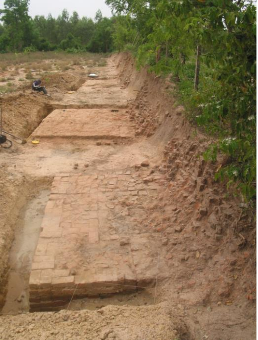
រូបលេខ១៖ ទួលគ្រឹះប្រាសាទ

ជាទូទៅទួលប្រភេទនេះសម្បូរឥដ្ឋបំផុត យើងឃើញមានពាសពេញទួលហើយ ប្រសិនបើមានការក្លែងរាស់ដើម្បីធ្វើចម្ការទៀតនោះ គឺឥដ្ឋដែលគេរើសគរទុកមានចំនួនច្រើនលើសលប់។ ទួលទាំងនេះក៏មានបំណែកកុលាលភាជន៍ផងដែរ។ ក្រៅពីឥដ្ឋ និងកាជន៍ យើងឃើញមានបំណែកស៊ុមទ្វារប្រាសាទ ប៉ុន្តែសរសរពេជ្រ និងផ្កែរដែលជាគ្រឿងលម្អសំណង់ប្រាសាទពុំបន្សល់ទុកនៅលើស្ថានីយឡើយ។