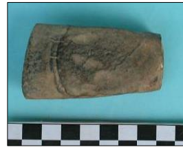
រូបទី៤៖ ពូថៅឬ