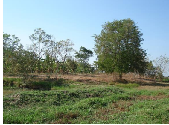
រូបលេខ២៖ ទួលយាយរិនជាប្រភេទទួលមនុស្សរស់នៅ

ទួលមួយប្រភេទនេះ គ្មានស្នាមគ្រឹះប្រាសាទទេ តែមានបំណែកកាជន៍ និងរបស់របរប្រើប្រាស់ផ្សេងៗ ហើយមានទំហំធំជាងទួលដែលមានឥដ្ឋ។ ដូច្នេះទួលនេះទំនងមិនមែនជាទីតាំងប្រាសាទទេ ប្រហែលជាទីតាំងលំនៅស្ថានរបស់មនុស្សទៅវិញ។