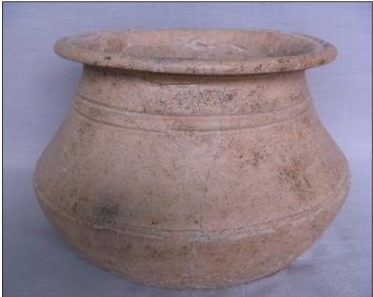
រូបទី៥៖ ឆ្នាំង

(សៀមរាប) អង្គរហុរី (តាកែវ) ជើងឯក (រាជធានី ភ្នំពេញ) ដែលកន្លែងខ្លះមានឡសម្រាប់ដុត ដូចជានៅតំបន់តានី និងជើងឯកជាដើម។