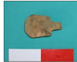
រូបទី៣៖ ពូថៅ

មាននៅក្នុងតំបន់នេះច្រើនជាង។ ដូច្នោះ ស្ថានីយស្រែអំពិលដែលមានវត្ថុឬសម័យបុរេ ប្រវត្តិ ក៏អាចជាស្ថានីយបុរេប្រវត្តិសាស្ត្រមួយ ដែរ។