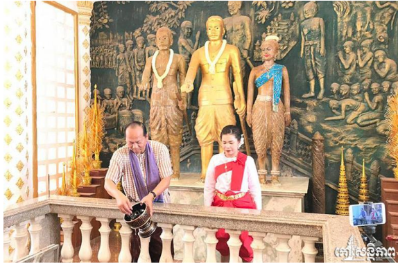
ការបន់ស្រន់អ្នកតាម្នាំងម្សីង ខេត្តពោធិ៍សាត់

ចំពោះម្ចាស់ដើម សមដូចសុភាសិតបុរាណ ខ្មែរពោលថា “ឆឹកទឹកនឹកដល់ ប្រភព” ឬក៏ ថា “ជ្រកក្រោមឈើធ្វើការវៈ ដល់អ្នកដាំ”