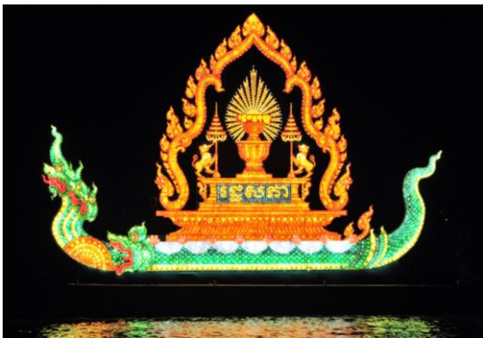
ទិដ្ឋភាពនៃពិធីលយប្រទីប