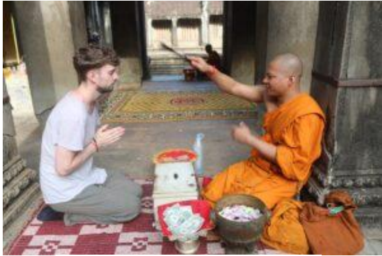
ជំនឿលើការប្រោះព្រំ

រូបភាពបង្ហាញពីការគោរពបូជា ចំពោះវត្ថុសក្តិសិទ្ធិ