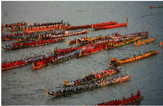
ទិដ្ឋភាពនៃពិធីបុណ្យអុំទូក

រូបភាពបង្ហាញពីការគោរពនិងការ ដឹងគុណដល់ម្ចាស់ទឹកម្ចាស់ដី